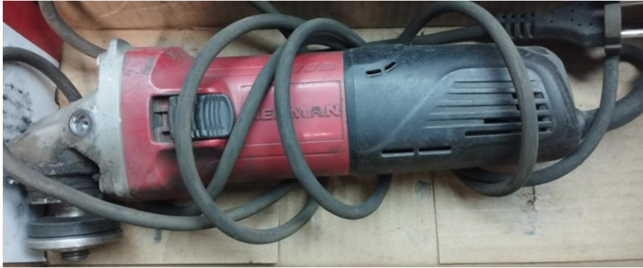
Obr.1 Stav náradia pri príjme