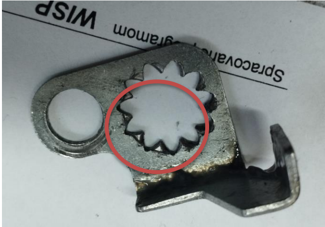
Obr.4 Poškodenie ozubenia aretácie