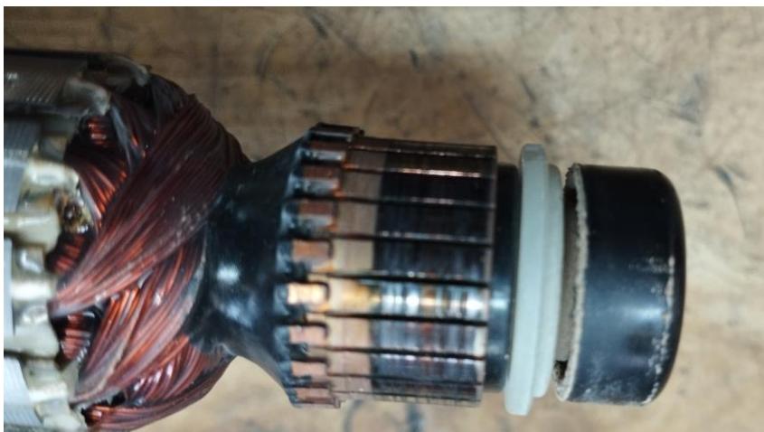
Obr.3 Poškodenie komutátora