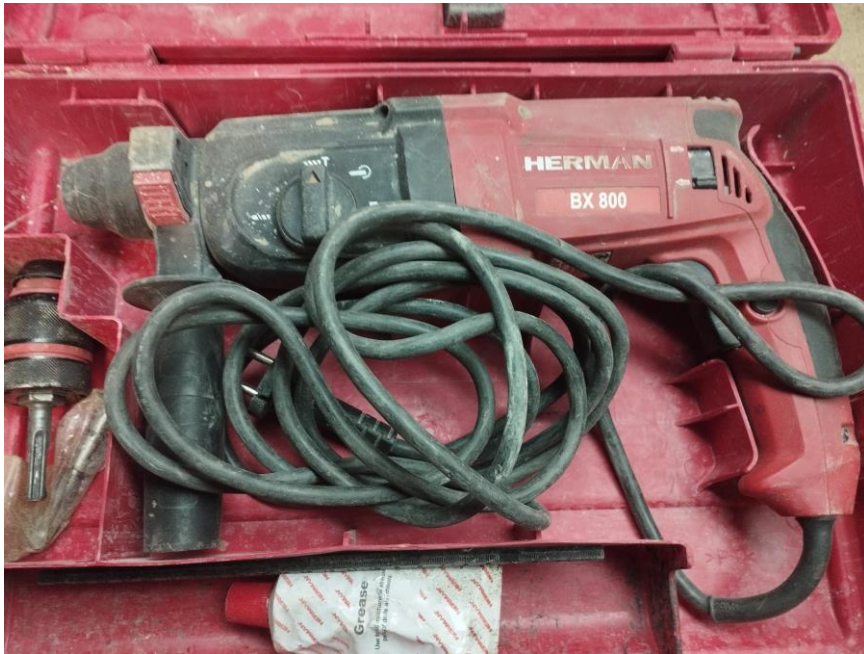
Obr.1 Stav náradia pri prijme