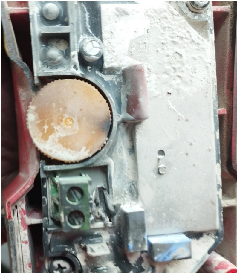
Obr.3 Zanesenie elektroniky nečistotami