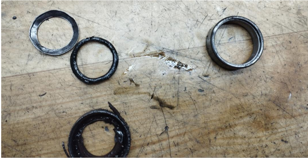
Obr.5 Poškodenie ložiska rotora