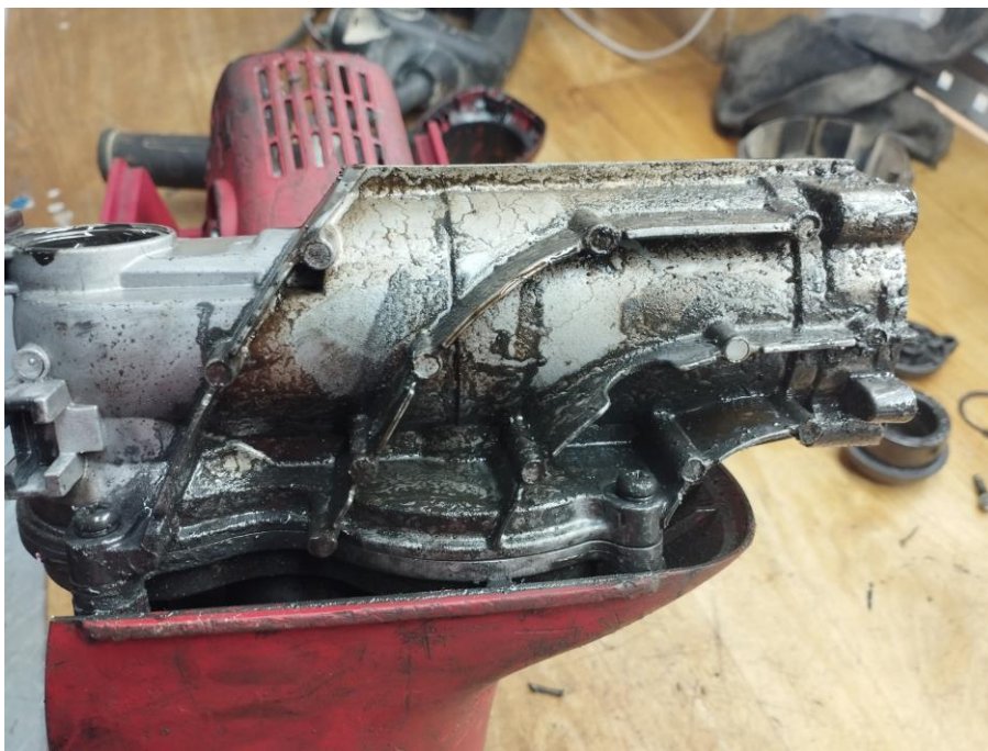
Obr.4 Vytečenie oleja z krytu prevodovky