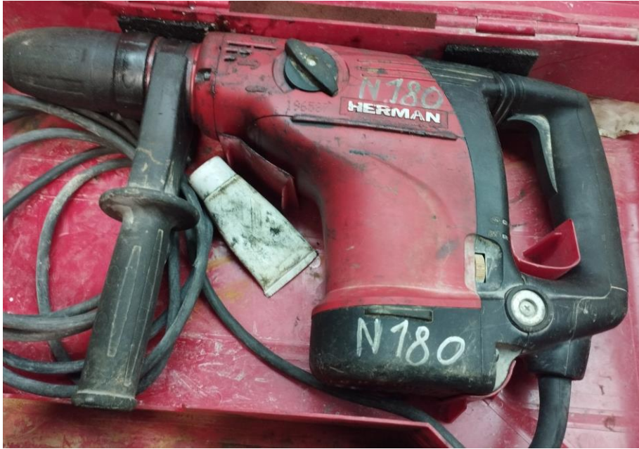
Obr.1 Stav náradia pri prijme