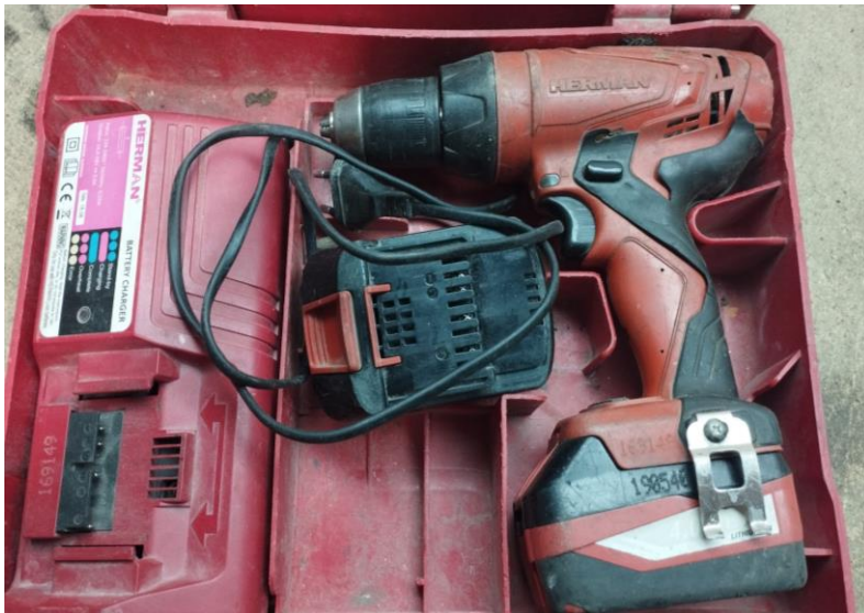
Obr.1 Stav náradia pri príjme